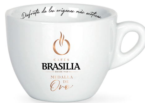
CAFÉ CON LECHE 200ML