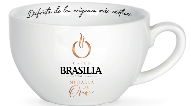
TAZA XXL 280ML

DIFERENTES FORMATOS DE VAJILLA PARA PODER OFRECER EL MEJOR CAFÉ EN TODAS LAS OCASIONES.